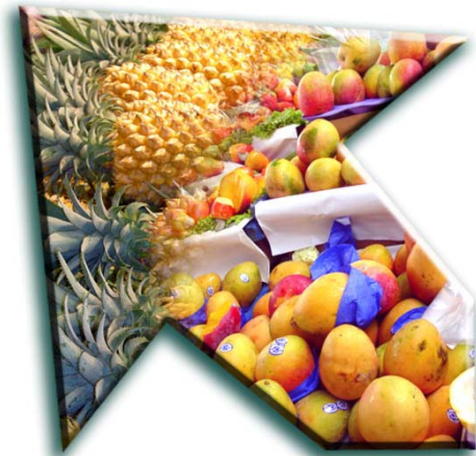
Table ronde n°3